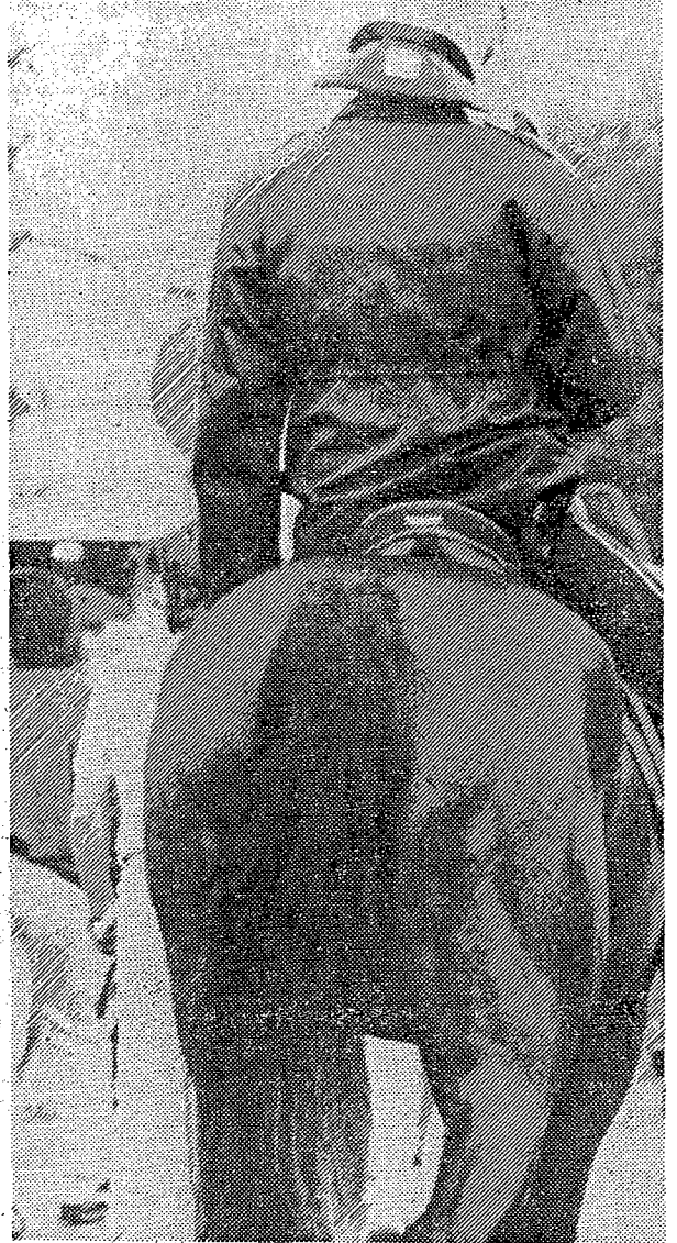
Feyenoord-supporters worden na de wedstr