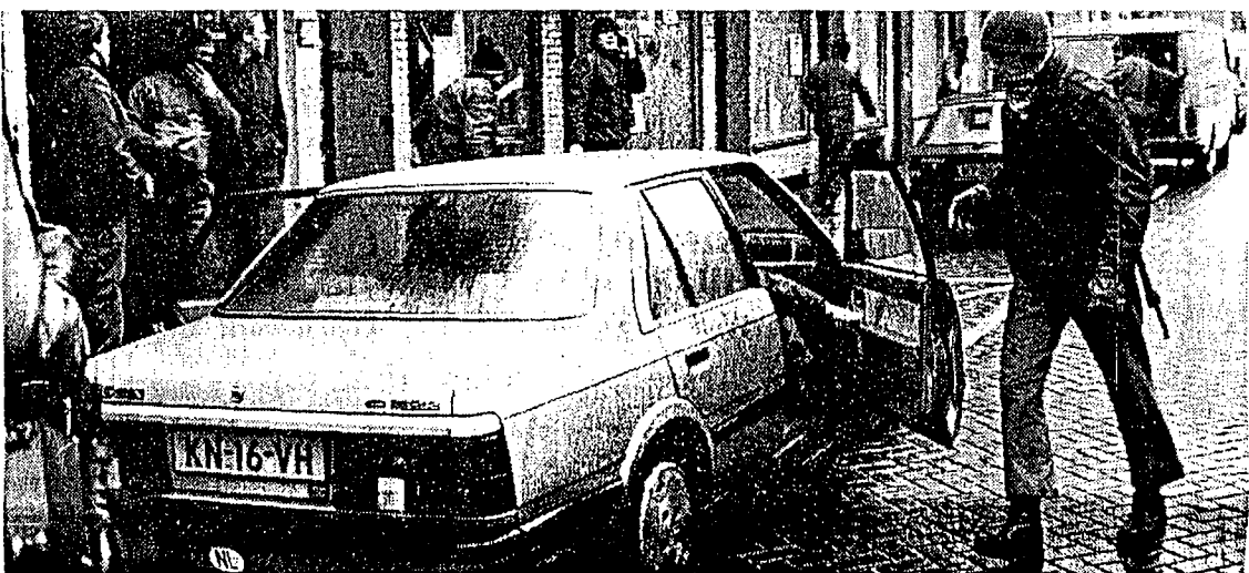
■ Niet alleen velschoppers maken zich tijdens ongeregeligheden vaak onherkenbaar. De politie heeft deze methode overgenomen. Om herkenning te voorkomen, gebruiken leden van de aanhoudingsteams gisteren sjaals en bivakmutsen. MD 25/3/87