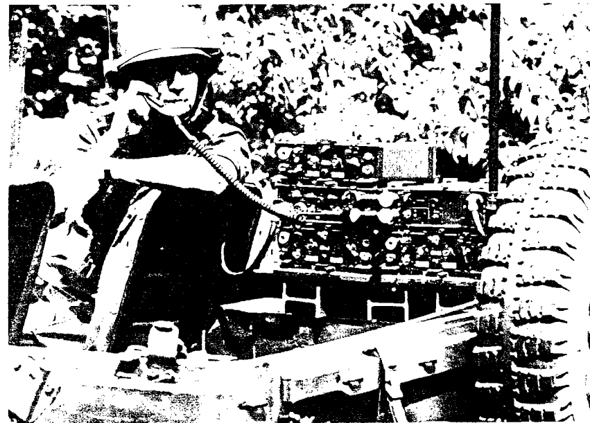
Deze militair beproeft een radio zender/ontvanger voor telefonie, ontworpen en gemaakt door de Hoofdindustriegroep Telecommunicatie, in Hilversum

Overigens is de waarde van al ons werk en de verandering die erdoor ontstaat, maar heel betrekkelijk. Het enige, dat je bij Signaal ziet, is dat het zich steeds meer begint te verdedigen, dat het erop wijst dat er steeds meer civiele productie komt. Pijnlijk is, dat alle civiele productie in Apeldoorn zit. Signaal vreest, dat er steeds meer weerstanden tegen het bedrijf ontstaan, als er alleen maar wapenproductie in Hengelo plaatsvindt. Het kan dan gebeuren, dat minder mensen voor vakatures te krijgen zijn. In bepaalde sectoren heeft Signaal nu al erg veel moeite om personeel te krijgen.