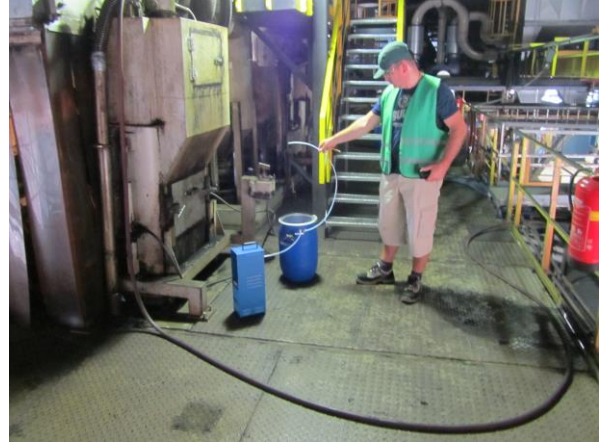
Molen A bordes 10:16 h