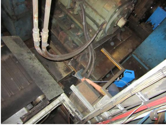
Boven molen A 09:35 h