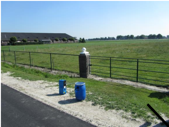
Referentiemonster Eindhovensebaan nabij no 7, ca. 200 m ten NO van Rumal.