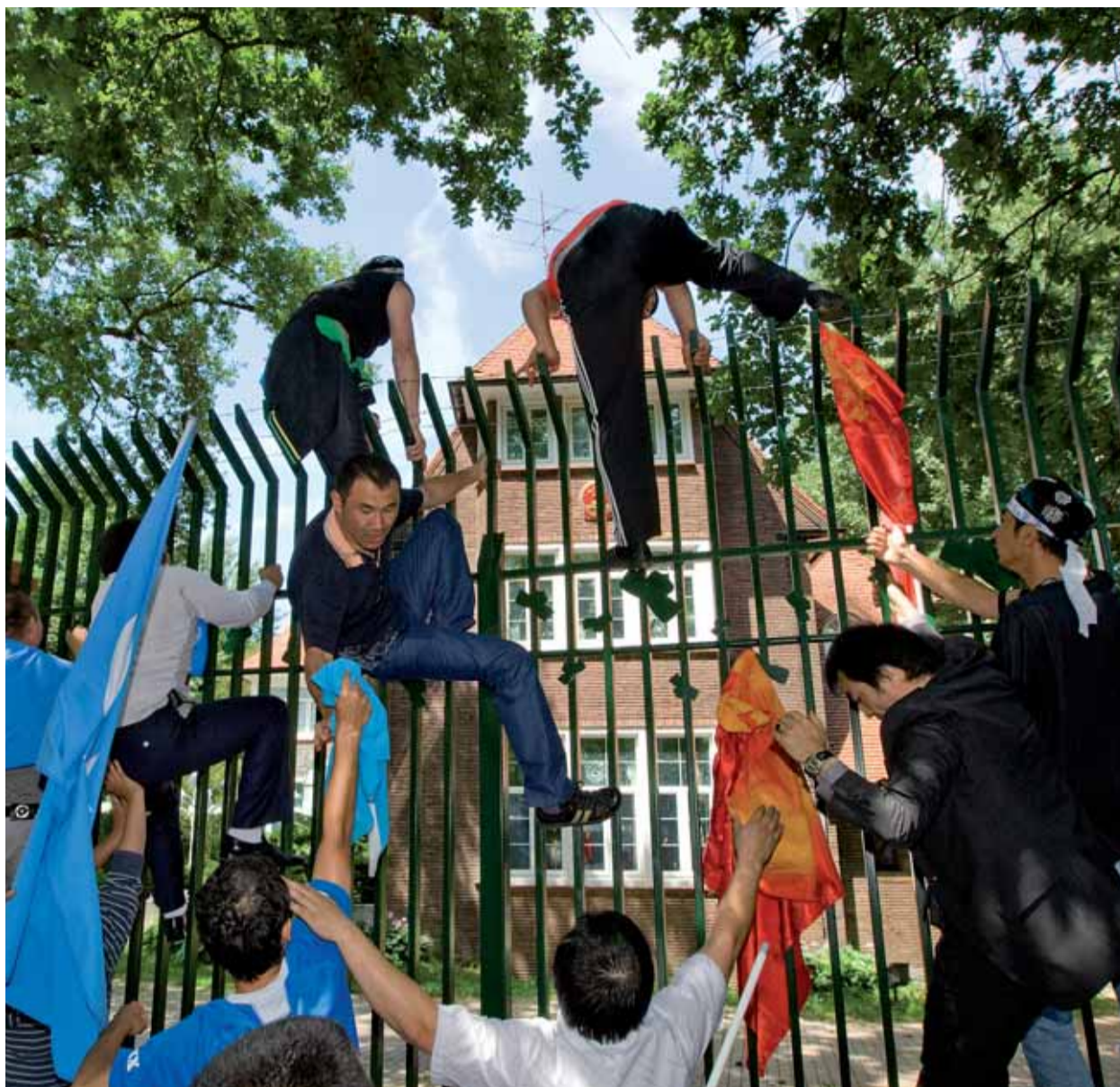
Op 6 juli 2009 werd gedemonstreerd bij de Chinese ambassade in Den Haag naar aanleiding van de situatie in de Chinese provincie Xinjiang. Na een half uur liepen de hevige emoties uit in spreekkoren en er werden stenen richting de ambassade gegooid. Uiteindelijk besloot het OM Den Haag lik-op-stukbeleid toe te passen en verdachten door middel van supersnelrecht voor de rechter te brengen.